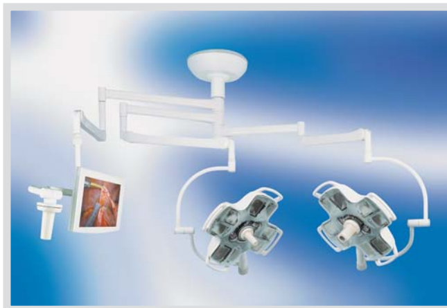
Возможны различные варианты конфигурации светильника X'TEN, включая установку встроенной видеокамеры с фиксированным фокусным расстоянием или с функцией ZOOM.