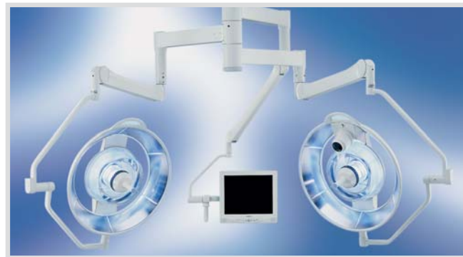
G8 EVOLUTION: один из возможных вариантов конфигурации светильника

Идеальные характеристики в ламинарном потоке: светильник HANAULUX G8 EVOLUTION специально создан для работы в ламинарном потоке воздуха. Ламинарный поток проходит через купол лампы, что позволяет свести к минимуму турбулентность. Постоянный дозированный поток воздуха препятствует накоплению бактерий под лампой, значительно снижая вероятность бактериального обсеменения раны.