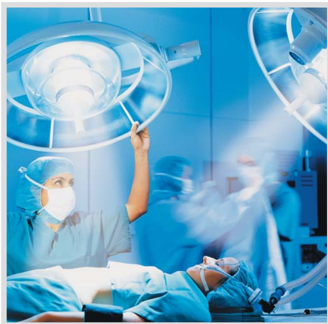
Конструкция светильника специально разработана для работы в ламинарном потоке

ReBulb: быстродействующий автоматический модуль переключения лампы с газоразрядной на резервную галогеновую обеспечивает бесперебойное освещение в случае выхода из строя основной лампы.